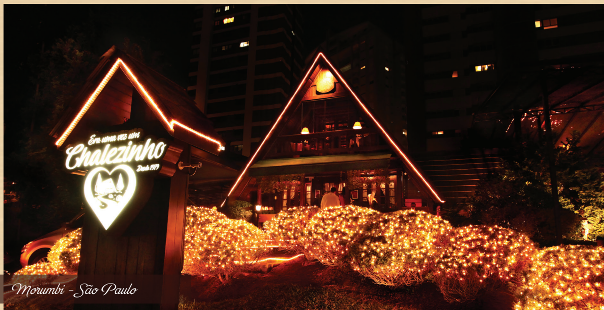
Morumbi - São Paulo