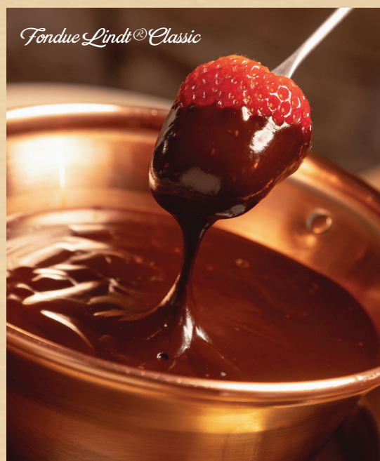
Fondue Lindt® Classic