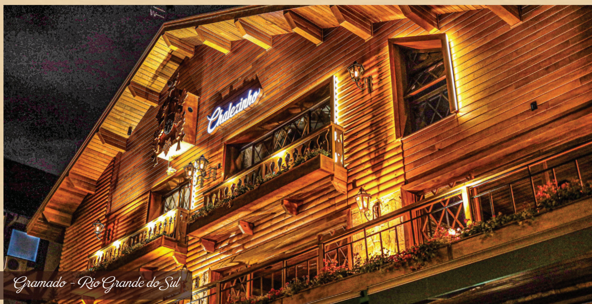
Gramado - Rio Grande do Sul