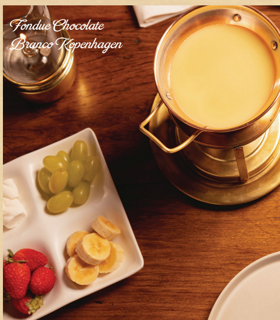
Fondue Chocolate Branco Copenhagen