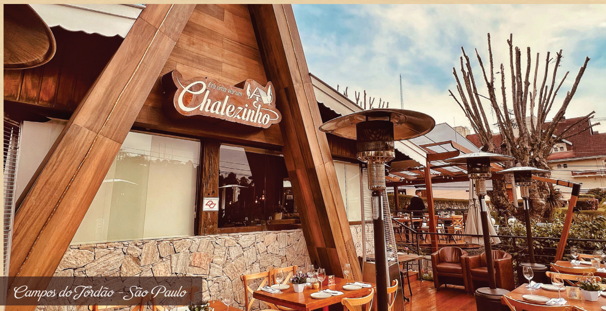
Campos do Jordão - São Paulo